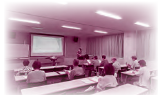
R6.9.4 『終活研修 ～わたしらしく生活するために～』