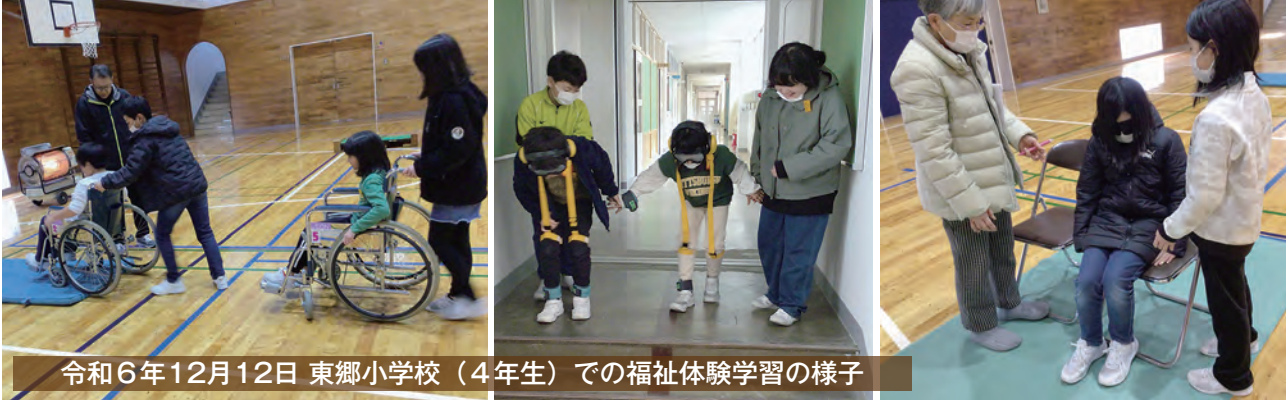
令和6年12月12日 東郷小学校（4年生）での福祉体験学習の様子

令和6年12月12日、東郷小学校4年生を対象に福祉体験学習をおこないました。「ふくしてなあに？」の講話をおこなった後、車イス体験、高齢者疑似体験、アイマスク体験をおこないました。今回の様々な体験を通して相手の気持ちを思いやる声のかけ方や接し方を考えるきっかけにさせていただきたいと思います。身近な人を思いやる気持ちを大切に、思いやりのやさしい芽がたくさん育つことを願っております。