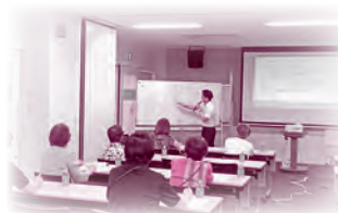
R6.8.28 『成年後見制度だけじゃない?! 将来を支える制度』